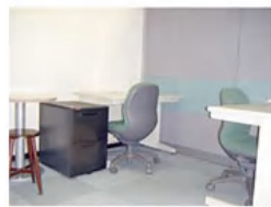
(写真は個室のイメージです。)