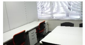
(写真は個室のイメージです。)